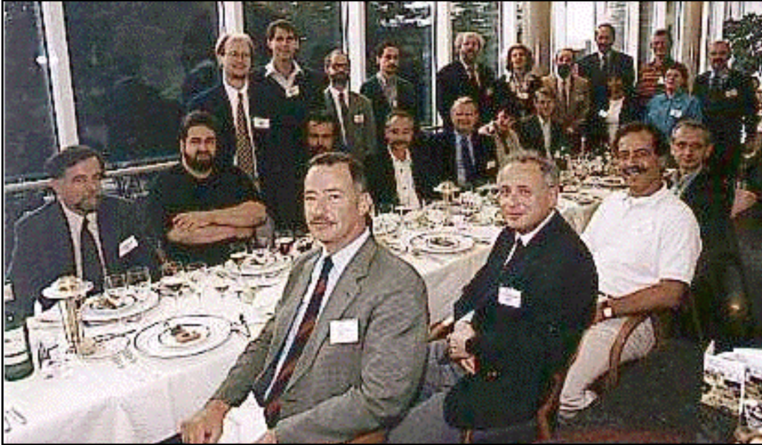
Les présidents des sociétés européennes de RO/AD lors de EUROXVI

approfondir cette démarche vis-à-vis des institutions de la recherche en France.